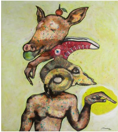
1. Steve Bandoma, Neter (2025) Encre et acrylique sur toile 100 x 90 cm © Steve Bandoma