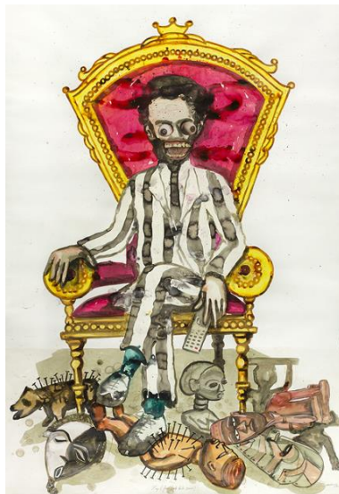
5. Steve Bandoma, Zap (2016) Technique mixte sur papier 180 x 120 cm © Steve Bandoma

Les visuels des œuvres de l'exposition sont disponibles sur demande à l'adresse : barlet@galerie-angalia.com .