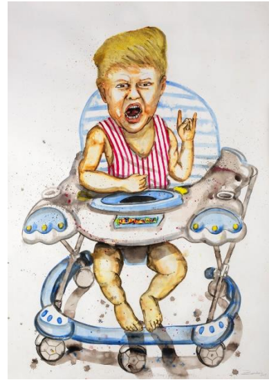
3. Steve Bandoma, Little Trump (2018) Encre sur papier 150 x 110 cm © Steve Bandoma