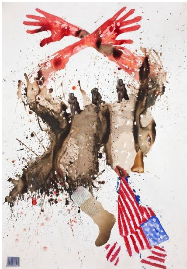
4. Steve Bandoma, Falling apart (2012) Encre et collage sur papier 103 x 73 cm © Steve Bandoma