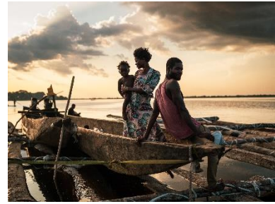
15. Famille conduisant un radeau de grumes, Mbandaka, province de l'Équateur, RD Congo, novembre 2025