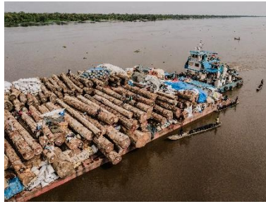
19. Une barge de grumes sur le fleuve Congo, province de l'Équateur, RD Congo, novembre 2025