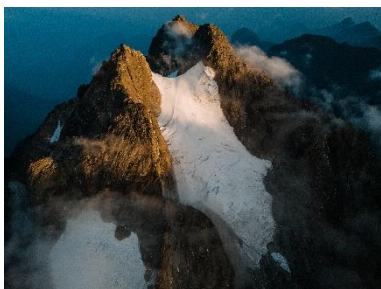
10. Le mont Stanley, parc national des Rwenzori, Ouganda, janvier 2025