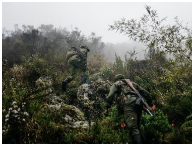
30. Rangers gravissant le mont Kahuzi, province du Sud-Kivu, RD Congo, octobre 2024