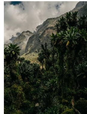
8. Parc national des Rwenzori, Ouganda, janvier 2025