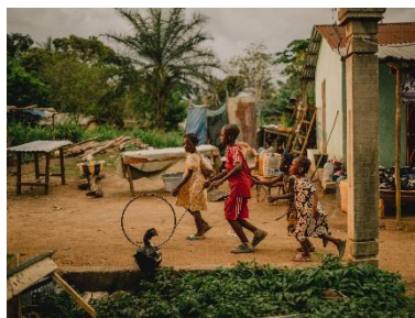
27. Dans le village de Mbomo, Odzala-Kokoua, République du Congo, octobre 2025

Les visuels des photographies de l'exposition sont disponibles sur demande à l'adresse :