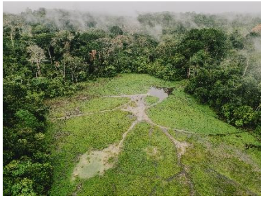
1. Une clairière dans la jungle d'Odzala-Kokoua, République du Congo, octobre 2025