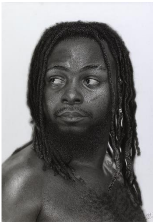
4. Ngule Freeman, Tala sima zonga mutu (2024) Graphite et fusain sur papier, 100 x 70 cm © PCP - Courtesy N. Freeman et Angalia