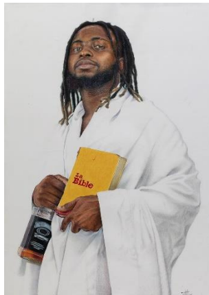
5. Ngule Freeman, 5 e évangile (2023) Crayons de couleur sur papier, 95 x 67 cm

Les visuels des œuvres de l'exposition sont disponibles sur demande à barlet@galerie-angalia.com .