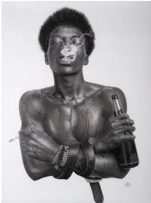
1. Ngule Freeman, Futur obscur (2020) Crayon graphite sur papier, 95 x 120 cm