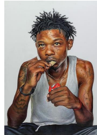
3. Ngule Freeman, Elikia (2023) Crayons de couleur sur papier, 100 x 70 cm © PCP - Courtesy N. Freeman et collection privée Bâle, Suisse